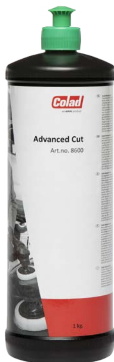
Арт. 8600 Объем: 1 кг

Абразивная полировальная паста, предназначенная для быстрой и агрессивной полировки поверхности. Не содержит растворителей, а следовательно удобна в использовании и безопасна для деталей из резины и пластика.