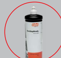
арт. 8700 (1 кг)