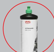
арт. 8600 (1 кг)